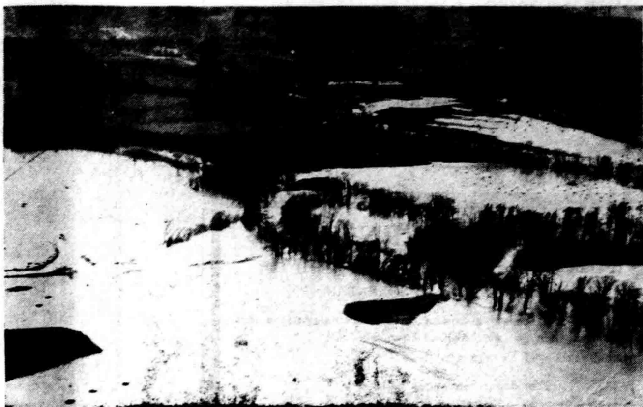
Diatas ini ialah pemandangan pada salah soeatoe tempat jang menderita kesoesahan karena bentjana air bandjir jang mengamoek baroe-baroe ini di Amerika Sarekat itoe. Gambar diatas diambil dari pesawat terbang didaerah Ohid (Cambridge).]